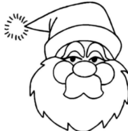
Le Père Noël

Barbe blanche et bonnet rouge, qui suis-je ?